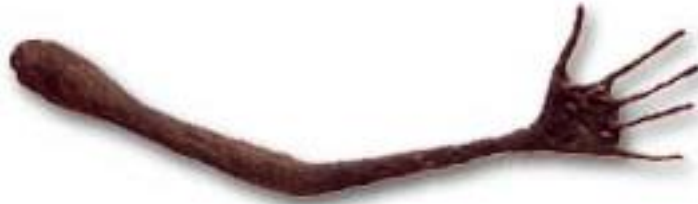
Giacometti, "El", Bronz, 1947

Derin bir yalnızlık duygusu!.. Sizi terkedip gitmeyen ve hep sizde kalan... Bir sokağın ortasında hızlı hızlı ilerlerken, insanların nefeslerinin bir vızıltı gibi suratınızı yalayıp geçtiği ve kendi yaralı yanlarına çekildikleri yalnızlıkta... Ağır aksak bir tını gibi uzaklaşan bedenlerin ve tüm görüntüleri emen sihirli bir aralıkta, bir köşebaşında boynunu bükmüş, sıska ve aylak bir köpek, ayak sesleriyle başınızı döven ve yalnızlığın paydasında bütünleştiğiniz Giacometti'nin köpeği... Her ne kadar başta, yoksullukla yalnızlığın göstergesi olması istenmişse de, bacak eğrisinin, belkemiği eğrisini karşıladığı düşünülürse, bu köpek sanki uyumlu bir paraf gibi çizilmiş, ancak bu paraf en yüce yalnızlık övgüsü olmuş gene. Giacometti o köpeğin kendisi olduğunu söyler. Bir keresinde sokakta kendimi böyle gördüm der, köpek olarak!..