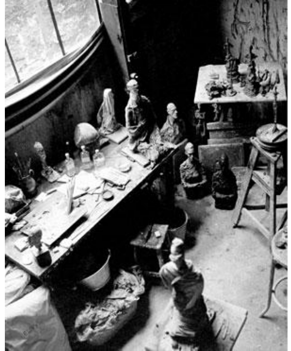
Giacometti'nin atölyesi, 1960

1954'de yazdığı notlarda bu şekilde betimlemiş Jean Genet, Giacometti'nin atölyesini... Ünlü sanatçının yaratım sürecinde yaşadığı sancıları, bu kirli tozlu atölyede oluşturduğu o cılız, iplikince heykellerinin varoluş serüvenini gözlemlemiş. Boşlukta dirimsel bir yalnızlığın coşkusunu temsil eden, maddesel ve tinsel bir derinlikte gidip gelen bu yontuların neredeyse tanrısal bir gerçekliğe yönelişini izlemiş gözleri kamaşarak... Herşey darmadağın, herşey bırakıldıkları yerden sanki hiç kalkmayacakmışçasına o yere ait... Ve Giacometti'nin atölyesini hiç temizletmediğini biliyoruz!.. Kimbilir; belki de nesnelere bu karmaşık ve keyfi konumlanışı kendi yaşamsallıklarını barındıran enerji, belirgin bir zamanın imgesi olarak gelişigüzel sıralanışları, atölyenin atmosferinin ta kendisi olmasındandır. Nesnelere bütünleşmek onların ruhlarına egemen olmanın ön koşulu değil midir?.. Her nesne, kendine dair tüm yaşanmışlıkların toplamı değil de nedir?..