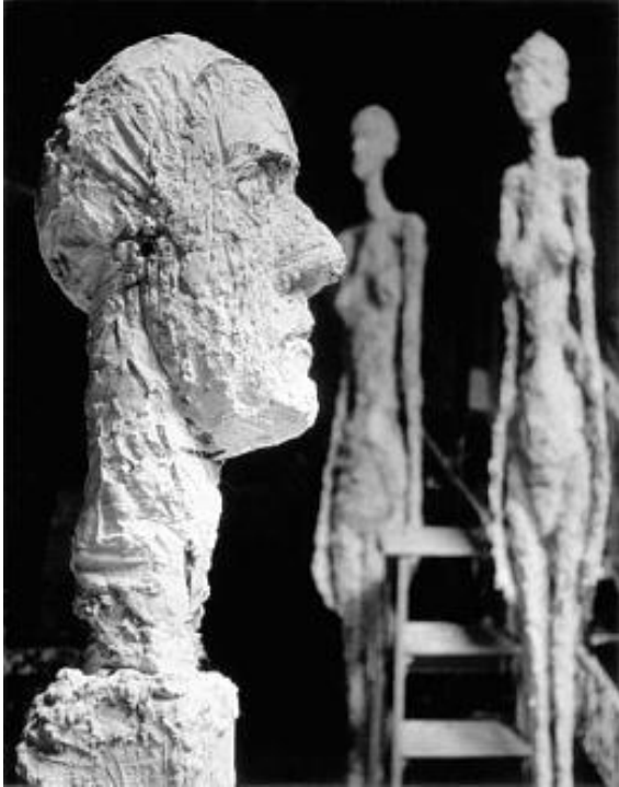
Giacometti'nin heykellerinden bir görünüş

"Giacometti'nin parmakları, sarmaşık budayan ya da aşılıyan bahçıvanınkiler gibi aşağıdan yukarı, yukarıdan aşağı inip çıkıyor. Parmaklar, heykelin gövdesi üzerinde oynadıkça atölyenin dört bir köşesi çınlıyor, yaşıyor. Garip bir duyguya kapılıyorum, sanki eski, bitmiş heykeller, Giacometti, her ne kadar onlara el sürmeyecek olsa da, sırf kendilerine bir kardeş yaptığı için bozuluyor şekil değiştiriyor. Zemin kattaki bu atölye yıkıldı yıkılacak zaten. Atölye çürük ahşaptan gri tozdan; heykeller alçıdan ve üzerlerinde ipler, üstüpüler, bazen bir parça çelik tel görünüyor, griye boyanmış tuvaler, boyacı dükkanındaki rahatlığını yitirmişler; herşey lekeli, herşey iskarta, herşey eğreti, yıkılıverecek, herşey dağılmak üzere, askıda, sallantıda: Ne var ki bütün bunlar sanki mutlak bir gerçeklik içinde yakalanmış gibi. Atölyeden sokağa çıktığımda, işte asıl zaman etrafımda hiçbir şey gerçek değil artık. Söylesem mi acaba? Bu atölyede, bir adam usulca ölüyor, tükeniyor ve gözümüzün önünde başkalaşıma uğrayarak tanrıçalara dönüşüyor."