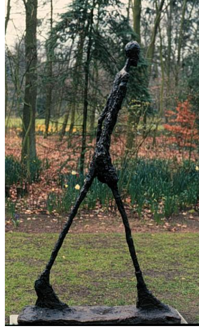
Giacometti, Striding Man