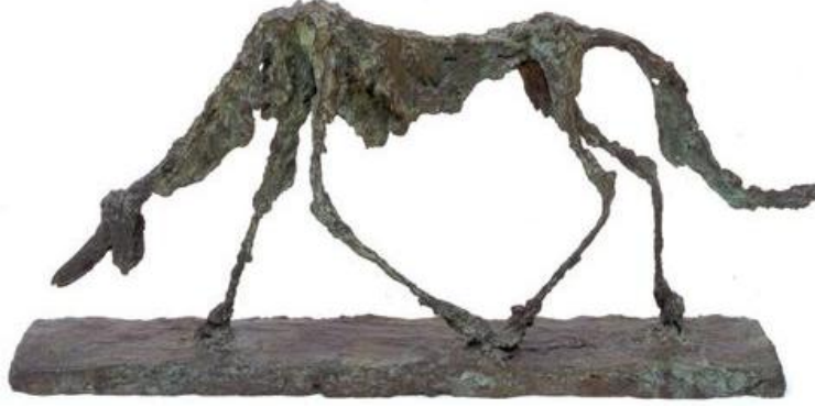
Giacometti, "Köpek", Bronz, 1951